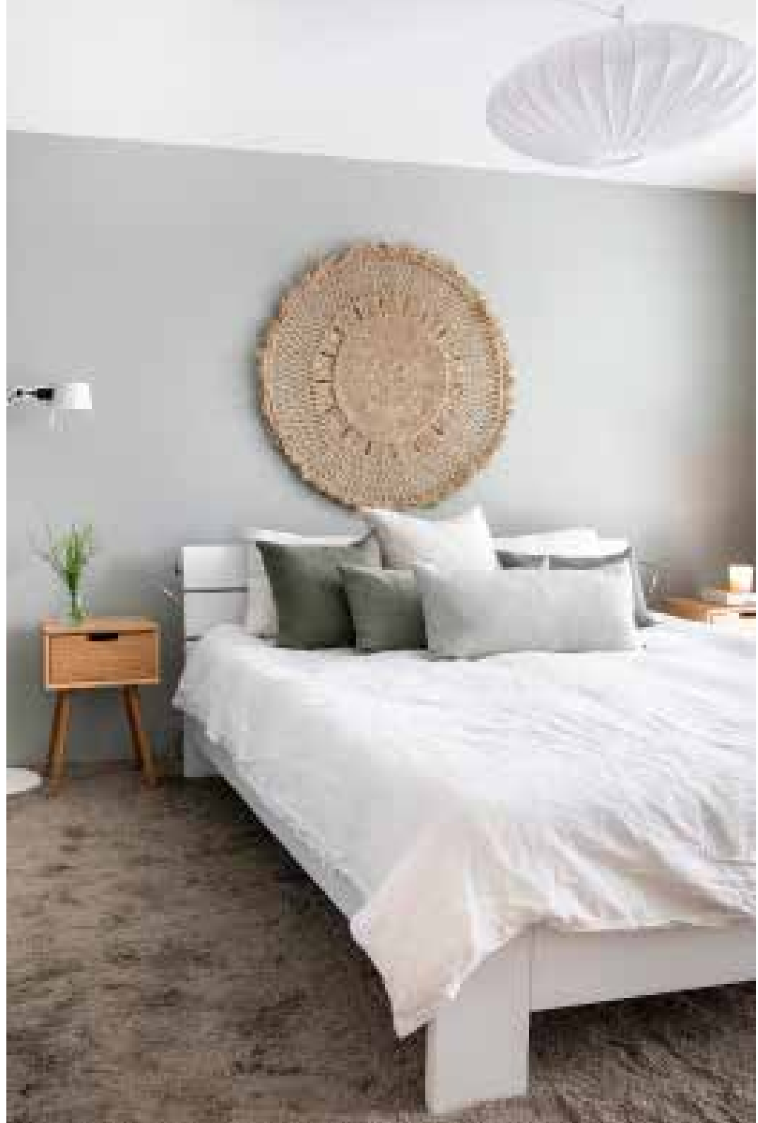
Vloerkleed van Perletta Carpets, de nachtkastjes Mitrana met bedlampjes van Tonone zijn van Home24. Linnen armatuur van Watt & Veke, mandala op de muur van Anne-Marie Wonen.

"ONS NIEUWE BUURTJE LIGT VLAK BIJ MEREN EN BOSSEN, EEN WELKOME VERANDERING ALS JE EEN GROTE STAD VERLAAT"