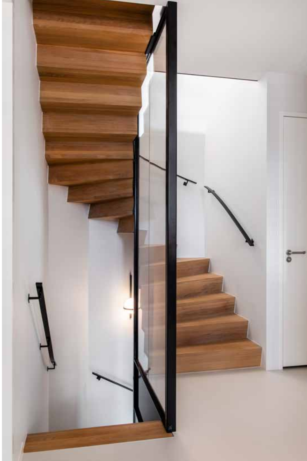
De offwhite gietvloer die je overal ziet, is van Senso Vloeren.

“IK VIND DAT DE GLADDE GIETVLOER EEN MOOI CONTRAST VORMT MET HOUTEN ELEMENTEN”