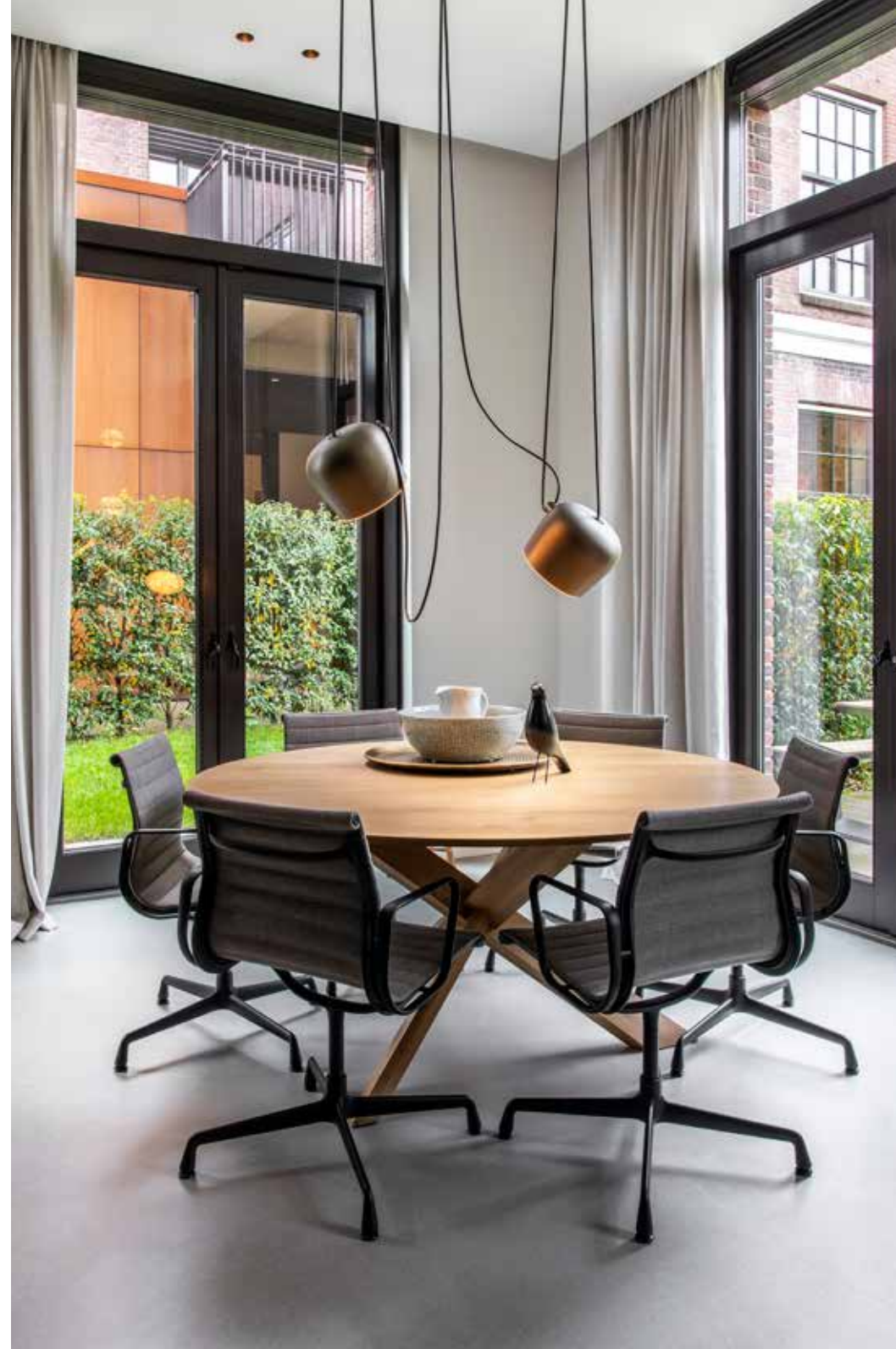
Eettafel Circle van Ethnicraft is gecombineerd met de Aluminium Chairs EA 104 van Eames bij Vitra, via Studiomove. Boven de tafel hangt lamp Aim van Flos.

“WE MISTEN EEN MOOIE LOCATIE WAAR DE KINDEREN VEILIG BUITEN KUNNEN SPELEN”