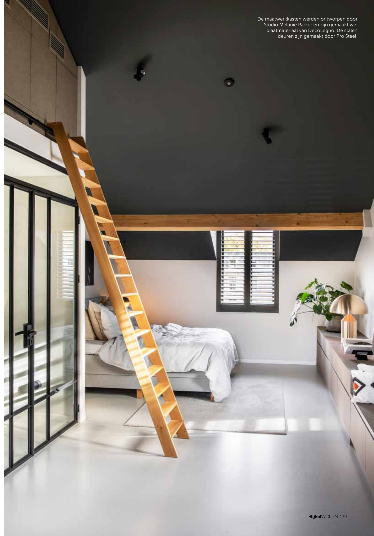
De maatwerkkasten werden ontworpen door Studio Melanie Parker en zijn gemaakt van plaatmateriaal van DecoLegno. De stalen deuren zijn gemaakt door Pro Steel.

“IK VIND DAT DE GLADDE GIETVLOER EEN MOOI CONTRAST VORMT MET HOUTEN ELEMENTEN”