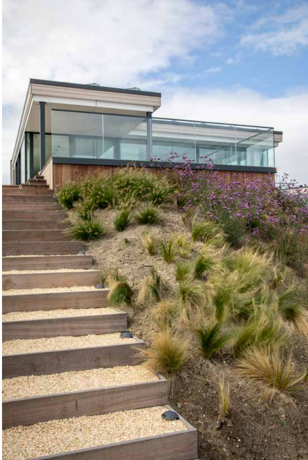
De tuin werd aangelegd met gewassen die van nature voorkomen in deze omgeving.