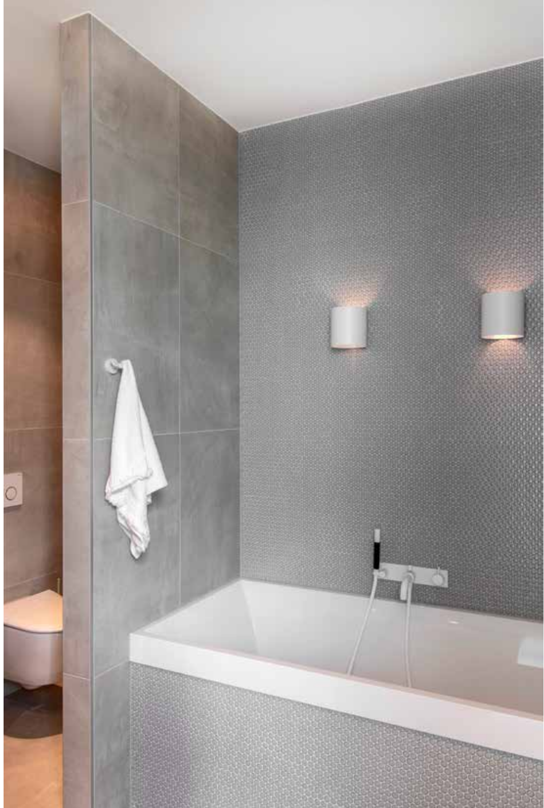
De grote tegels op vloer en wand zijn van Piet Boon by Douglas & Jones, verder is er een blauwgrijze Venice Pennyround Mozaïektegel te zien. Kranen van het label Hotbath. Spots van Modular Lighting, model Smart Lotis. Wandlampjes 4.0 van Wever & Ducre.